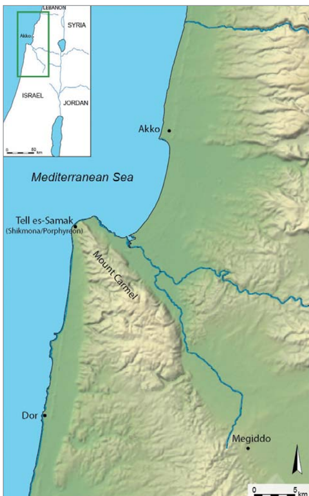
איור 1: מפת התמצאות (שרטוט ס' עד).

ה־6 ולא התגלה כל חורבן שניתן לשייכו לכיבוש המוסלמי. יתרה מכך, הישוב כנראה ניטש בסוף המאה ה־6 לספירה. המחקר של שקמונה מהתקופה ההלניסטית ואחריה התמקד בתקופה הביזנטית משום שרק שרידים מועטים ביותר נחשפו מן התקופות ההלניסטית והרומית, הן בתל והן מחוץ לו. בכנסייה הדרומית התרכז עיקר המאמץ הארכיאולוגי מחוץ לתל, וכך נחשפה אחת הכנסיות הקדומות בישראל, שהקמתה מתוארכת לסוף המאה ה־4 – ראשית ה־5 לספירה. איזנברג במאמרו על כנסייה זו דן בחשיפת שטיחי פסיפס מפוארים, ובאלה הושקעו מרב מאמצי השימור וההצלה.