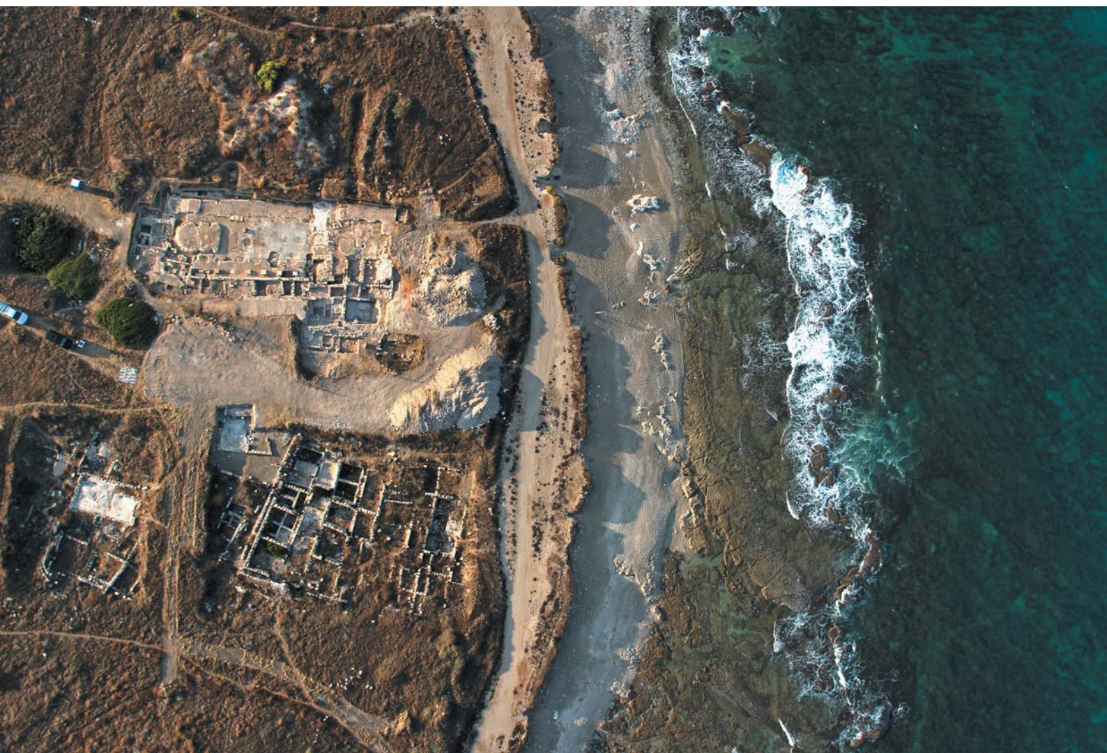
The southern part of Tell es-Samak (Shikmona/Porphyreon).