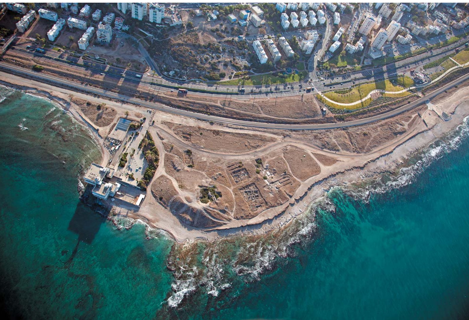
סביבת תל א־סמך והמורדות המערביים של הכרמל.